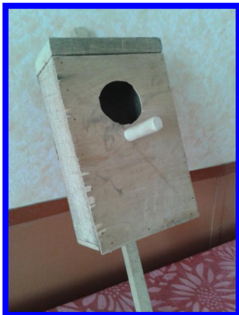
Шеверёва Алёна 5 класс