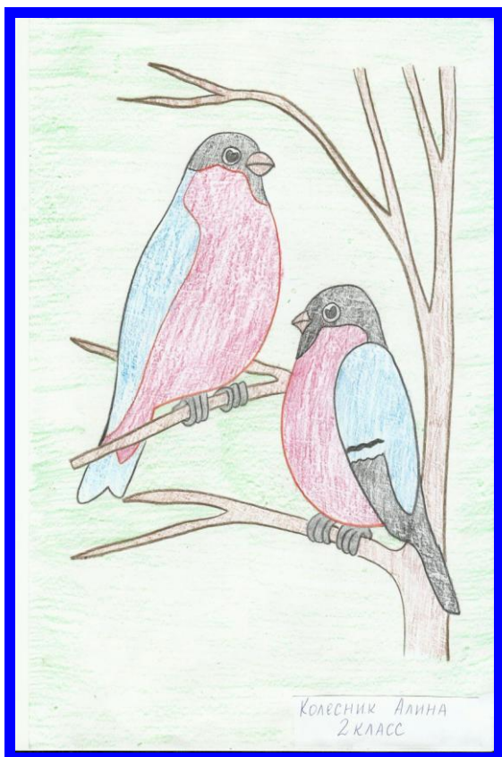
Колесник Алина 2 класс