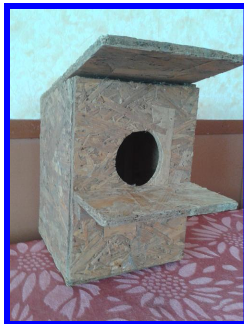
Степанов Максим 5 класс