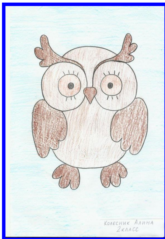
Колесник Алина 2 класс