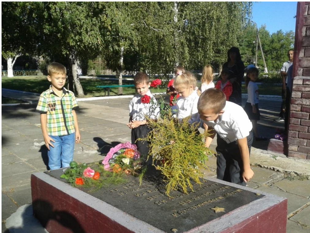
Возложение цветов в День освобождения Донбасса