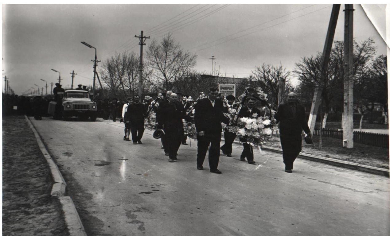
В 1974 году произошло перезахоронение погибших воинов из села Сосновское и братской могилы в село Приморское.