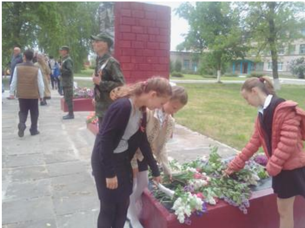
Митинг 9 мая